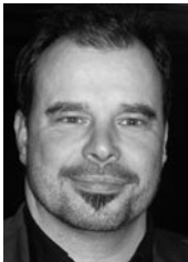
3. Vorsitzender der Ausschüsse