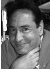
1. Vorstand/ Jugendwart